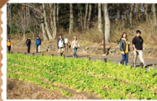
十日市場 市民の森

ウォーキングは、いつでも、どこでも、だれにでもできる体に優しい有酸素運動。健康維持やダイエット…100kmウォークにチャレンジしてみませんか。しかも楽しくウォーキングしながら神奈川を再発見!是非家族そろってご参加ください!!