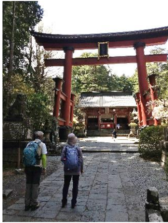
「北口本宮富士浅間神社」