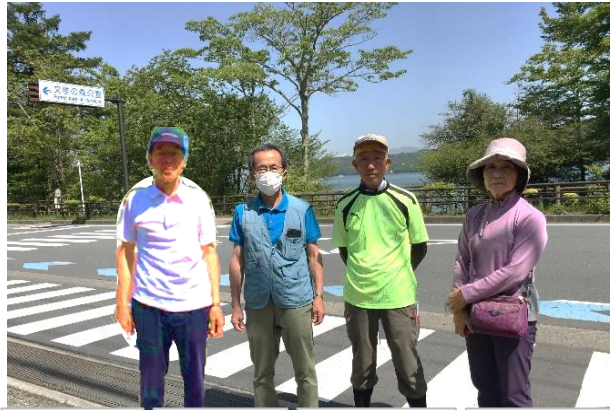
かなざわ高橋 あつぎ大田 かわさき佐藤 みどり羽田