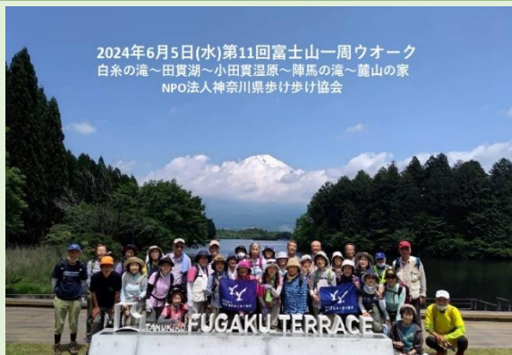
2024年6月5日(水)第11回富士山一周ウォーク 白糸の滝～田貫湖～小田貫湿原～陣馬の滝～麓の山小屋 NPO法人神奈川県歩け歩け協会