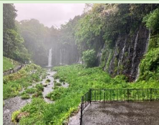
⑩回目の白糸の滝が今回のスタートです。

一時は姿を見せたものの、主役のMt.FUJIは、薄いカーテンの向こう側でした。だらだらと坂道を上り詰めたその先の田貫湖には、女神さまが住んでおられるような美しく、神秘的な湖でした。今回も、苦しくもワクワク感あふれるコースに頑張った「めげずに歩くシニアパワー」です。