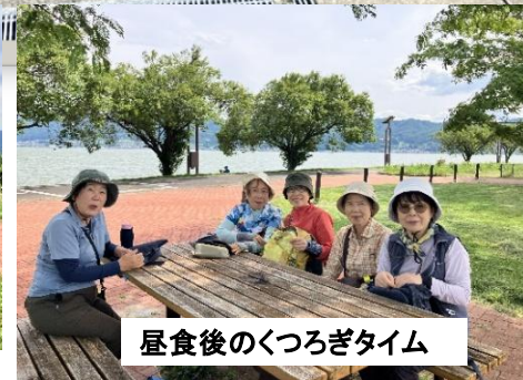
昼食後のくつろぎタイム