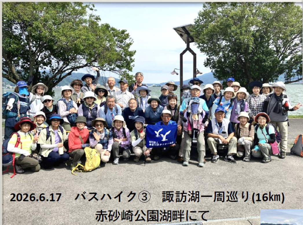
2026.6.17 バスハイク③ 諏訪湖一周巡り(16km) 赤砂崎公園湖畔にて