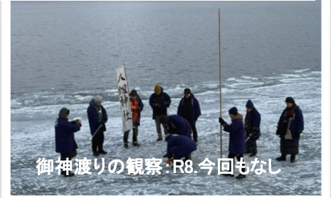
御神渡りの観察：R8.今回もなし