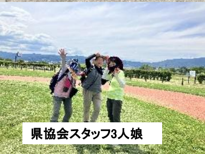
県協会スタッフ3人娘