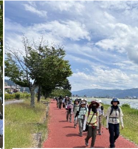
杜快なスタートです。